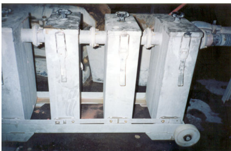
Conjunto de 4 Filtros "M" montados em série, em linha de barbotina