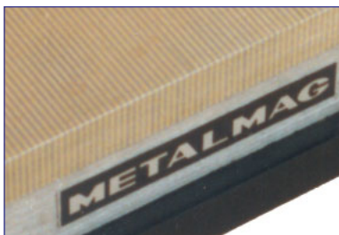
★ Pólos Ultra-Finos - para a fixação de peças pequenas e finas