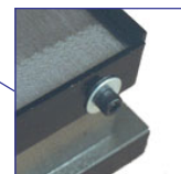
Réguas de encosto reguláveis: padrão em todos os modelos retangulares