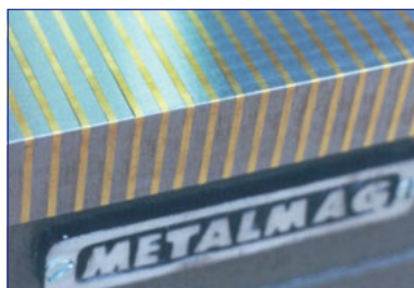
★ Pólos Finos - maior versatilidade: peças grossas ou finas