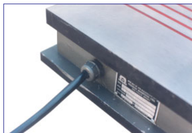
Conexão elétrica reforçada, com total vedação