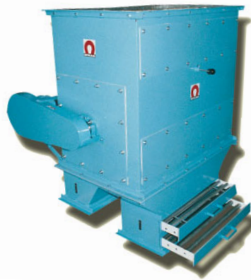
Carcaça especial, com Grades Magnéticas na descarga dos não ferrosos