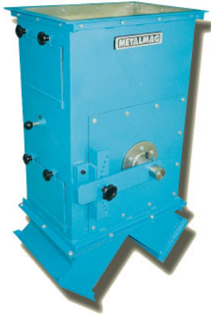
Carcaça padrão, com um Tambor Magnético