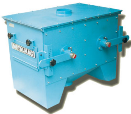
Modelo especial, com dois Tambores em paralelo, para grandes vazões