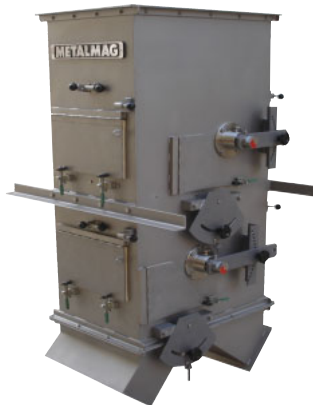
Modelo duplo, com dois Tambores em cascata, para separação fina, com carcaça em aço inoxidável