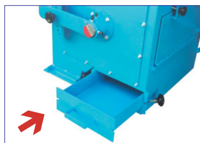
Descarga com gaveta recolhadora do material ferroso (opcional)